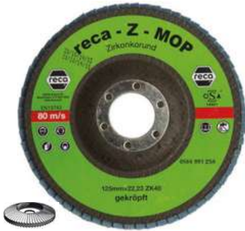
Lamelový brúsny kotúč so zirkónovým korundom Z-Mop

Základný brúsny lamelový kotúč vhodný najmä na obrábanie ocele.