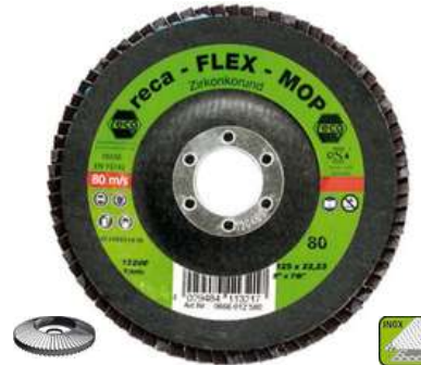
Lamelový brúsny kotúč so zirkónovým korundom Flex-Mop