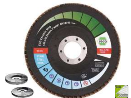
Lamelový brúsny kotúč s keramickým zrnom je navrhnutý pre maximálny úber materiálu a dlhú životnosť Ceramic-Mop Eco